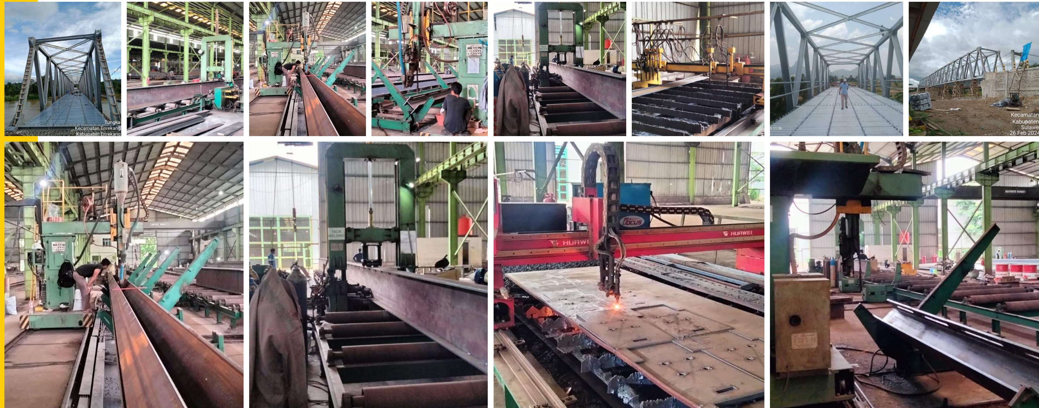
Tungka Kecamatan Enrekang Kabupaten Enrekang